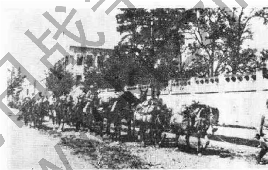
日軍奉中國政府命令集中