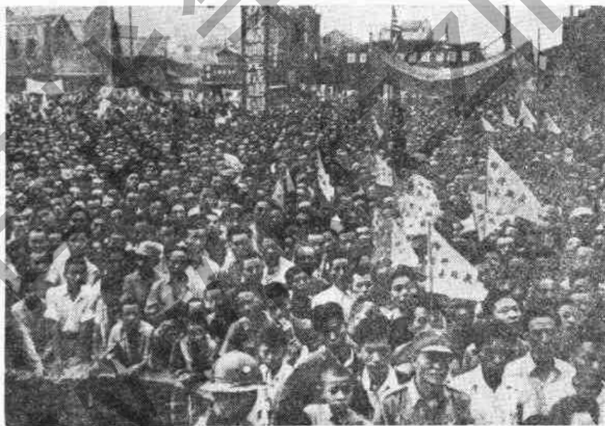
陪都重慶各界慶祝抗戰勝利大會

八月十七日岡村將軍覆電遵辦。嗣以浙江玉山機場天雨跑道不能使用，八月二十一日日軍投降使節今井武夫少將（Imai takeo）等一行八人，改在湖南芷江機場降落。當由陸軍總部參謀長蕭毅肅中將召晤，並代表陸軍總司令何應欽上將授予第一號備忘錄，指示日軍投降應行遵辦事項。該備忘錄詳附件九，蕭毅肅中將囑今井少將携返南京，遵照辦理。