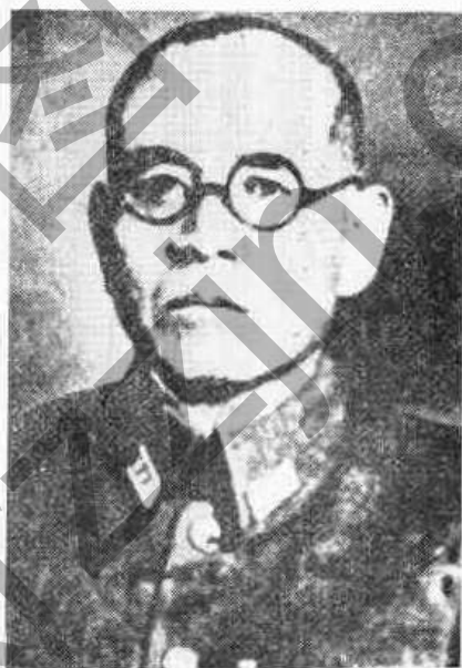
日本中國派遣軍總司令官 岡村寧次大將

三、軍事行動停止後，日軍可暫保有其武裝及裝備，保持現有態勢，並維持所在地之秩序及交通，聽候中國陸軍總司令何應欽之命令。