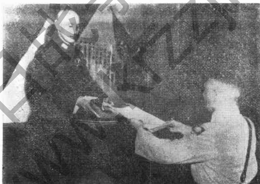
冷欣將軍向 蔣委員長呈遞日本降書