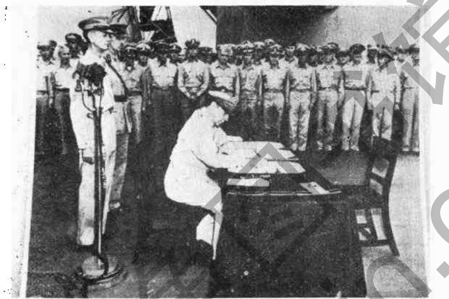
盟軍統帥麥克阿瑟將軍在密蘇里艦接受日本投降

聚集於此。各種有關連的問題，在世界戰場上業已決定，我們已無再行討論的必要。可是代表着地球上大多數人民的我們，並不是懷着猜疑、惡意和憎恨的情緒，而來此聚會。