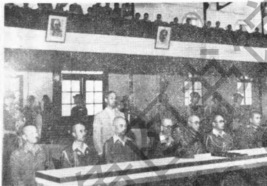
日軍投降代表在南京恭聽何總司令指示