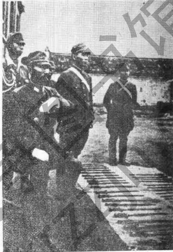
日本軍官指揮日軍放下武器

六、第三戰區顧祝同上將為受降主官。日軍部隊為133D，62BS，91B，集中杭州。海軍陸戰隊集中廈門。日軍投降代表為13A松井太久郎