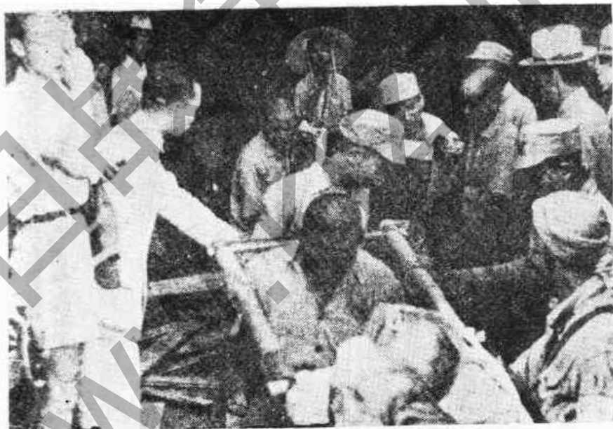
日機對重慶轟炸重慶大隧道死992人，傷151人

日本恃強凌弱，甲午戰爭日本戰勝，迫中國割讓台灣與澎湖列島，並強索賠款庫銀二萬萬兩。「九一八」事變強佔中國東北四省；「七七」之後，繼之以「南京大屠殺」，「重慶大轟炸」，可謂血海深仇，罄竹難書！而今日本戰敗，該是復仇洩憤的時候了！然而中華民國領袖 蔣委員長，秉承中華民族至高至貴之德性，呼籲全國軍民同胞「不念舊惡」，「以德報怨」，除責成日本忠誠履行投降條款外，決不冤冤相報。