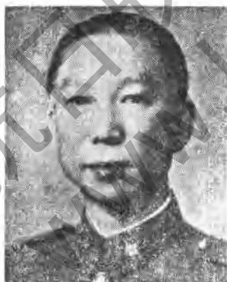
第九戰區司令長官 薛岳上將