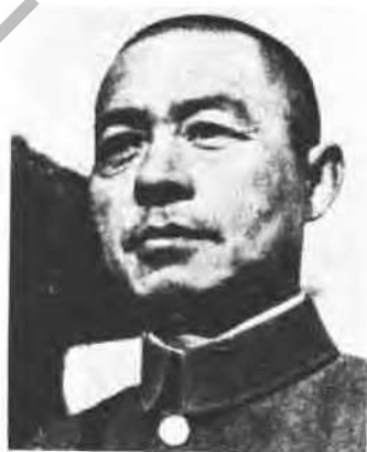
第三十三集團軍總司令 張自忠上將（宣城殉國）