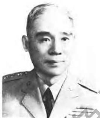
第三戰區司令長官 顧祝同上將