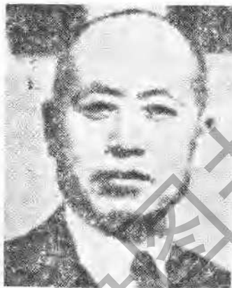
蘇魯戰區司令長官 于學忠將軍