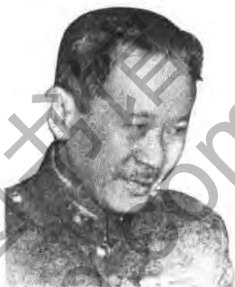
第四戰區司令長官 張發奎上將