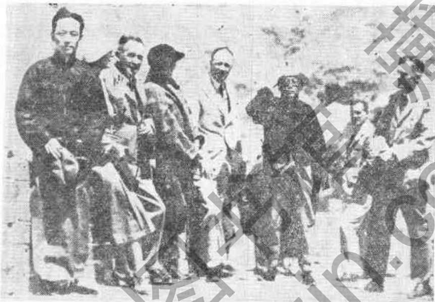
拒絕土肥原游說的宋哲元將軍（中穿長衫者）