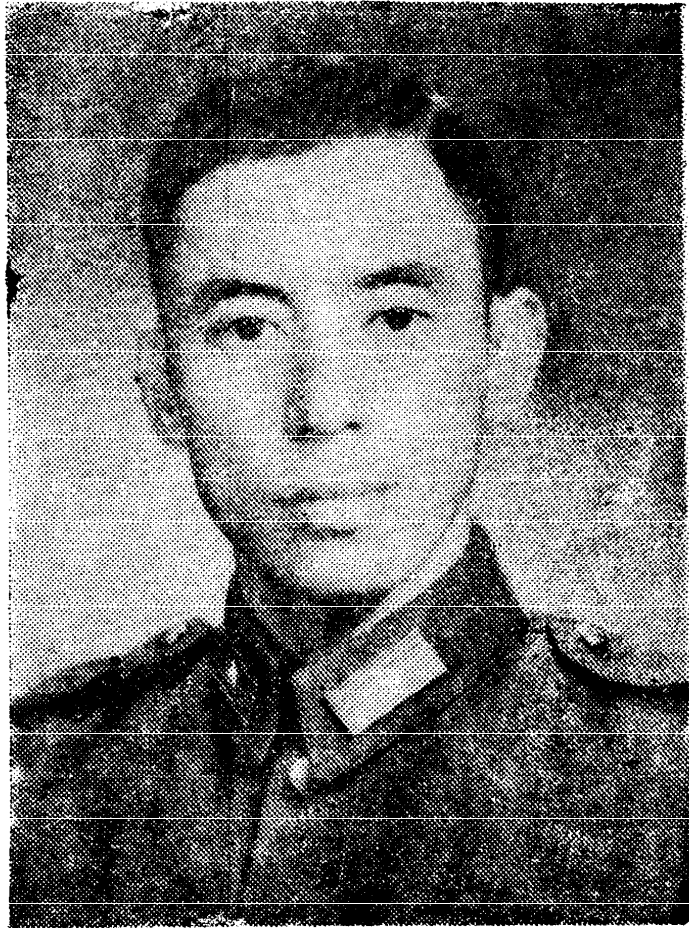
像 肖 者 著